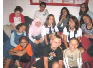
Groep 6 en 8

schoolappartement loopt af in Augustus 2009. Het bestuur heeft met de eigenaresse overeenstemming bereikt over verlenging van de huur.